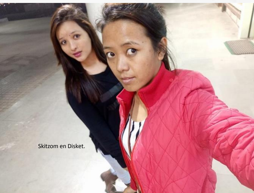
Skitzom en Disket.

Elke dag werd het warmer. Dit is het examen seizoen. Overdag ging ik naar college en 's-avonds trainde ik en speelde voetbal. Zoals gewoonlijk. Toen de examens dichterbij kwamen, reduceerde ik de trainingen en het voetballen, om me op mijn studie te concentreren. De examens begonnen in mei en namen bijna een hele maand in beslag. Het was een uitzonderlijk hete maand, maar de gedachte dat ik na de examens naar Leh zou gaan hield me op de been. In Leh is het weer zoveel lekkerder dan in Chandigarh. Ik bracht mijn hele zomervakantie door in Ladakh. Ik deed mee aan een voetbaltoernooi in Leh en ik reisde rond. Met een vriend ging ik van Leh naar Hanley* op de motor. Met een van mijn voetbalmaatjes heb ik geraft op de rivier. Ik heb mijn moeder geholpen met haar tentrestaurant in Pang. Ik had, eerlijk gezegd,