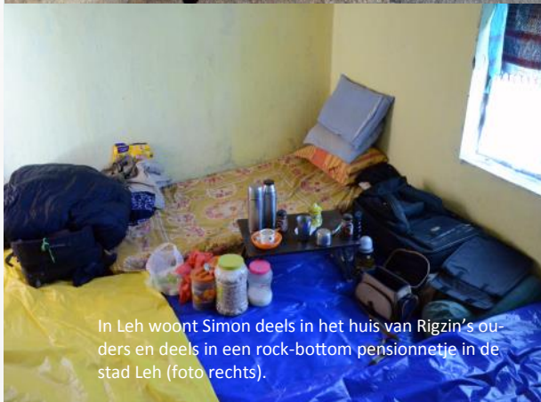
In Leh woont Simon deels in het huis van Rigzin's ouders en deels in een rock-bottom pensionnetje in de stad Leh (foto rechts).